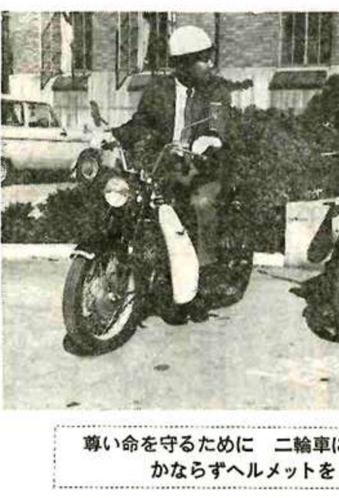
尊い命を守るために 二輪車に乗るときは かならずヘルメットをかぶりましょう