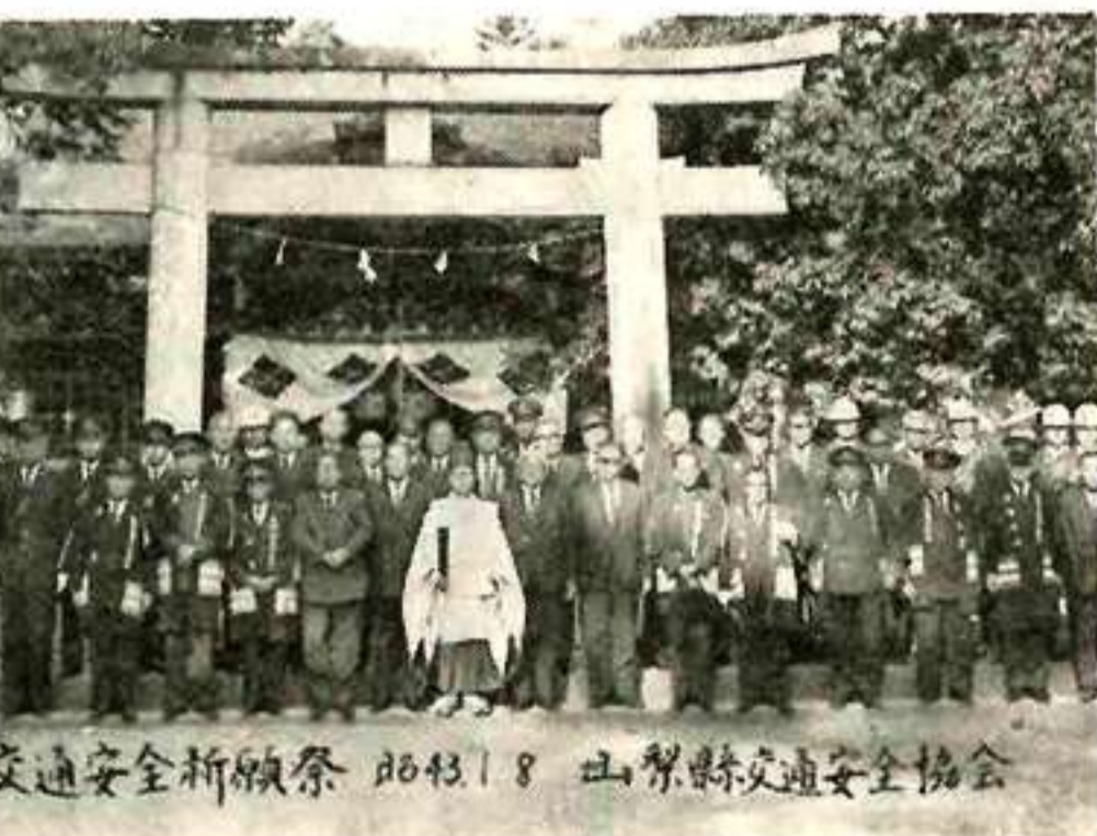
交通安全祈願祭 昭和43年1月8日 山梨県交通安全協会

ヘルメットを かぶってください 山梨県交通安全協会 バイクの事故の多くは、 頭部の受傷です。頭部受傷 は、死亡率が高く、また、 負傷した場合でも、神経障 害などの重い後遺症にかか っています。 このような、恐ろしい頭 部受傷からあなたを守るた めに、ぜひヘルメットをか ぶってください。 なお、十二月、一月、二 月、三月の四か月間にかぎ り県交通安全協会において は、次の特別割引価格によ り、ヘルメットを軽旋しま すので、ご利用なさる方 は、各警察署内にある地区 交通安全協会に申し込んで ください。 JISマーク付 A型ひさしの無いもの 一、三〇〇円 B型ひさしの有るもの 一、二〇〇円 風防付は一五〇円増し