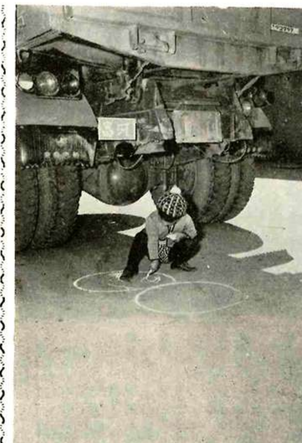
あそびません こわいくるまのと おるみち — もしこの車がバックしたら —