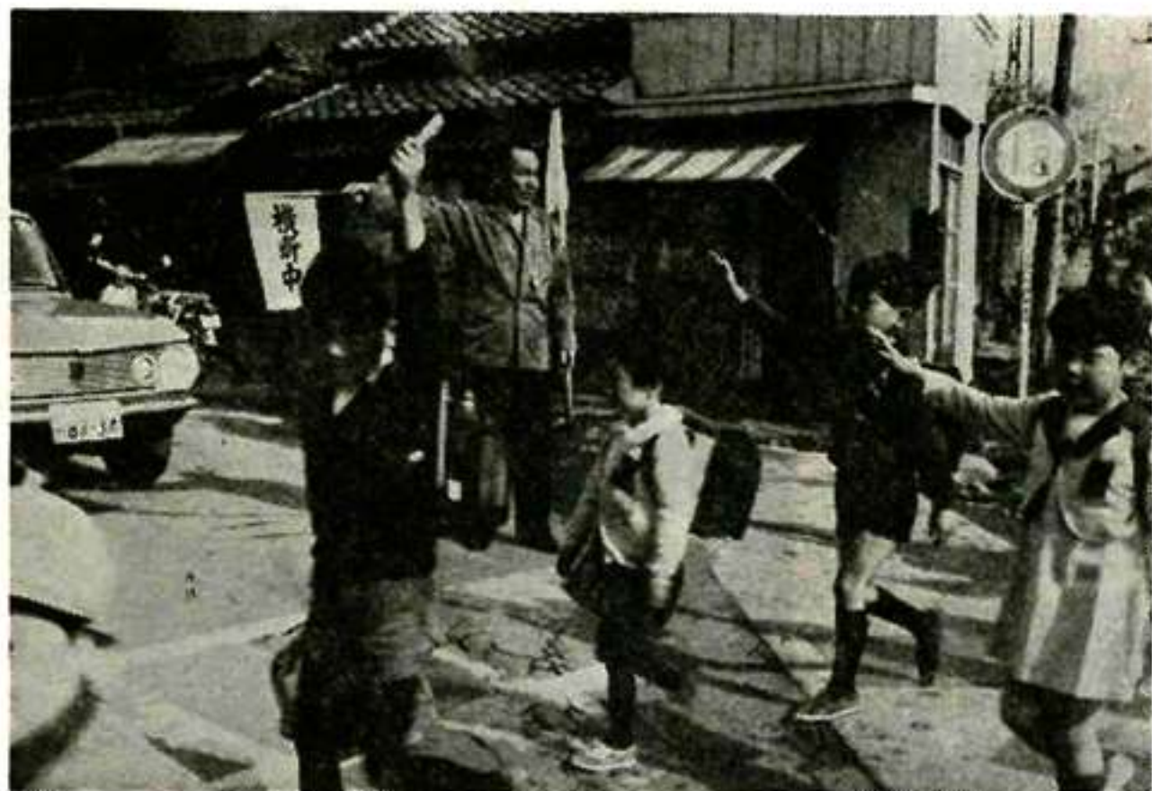
たしかめて おてゝをあけて さあ、横断

れないことを知り、道路への急なとび出しはしない。 キ、横断歩道の手前で、自動車を徐行し、追越し、追抜きはしない。 ク、横断歩道に人がいるときは、自動車は必ず一時停止する。 ク、通学、通園路及び踏切道における安全の確保。 ア、通学通園路を再検討し、安全確保につとめる。 イ、登下校には必ず、通学、通園路を通る。 ウ、集団による歩き方と、一人の歩き方を実地に指導する。