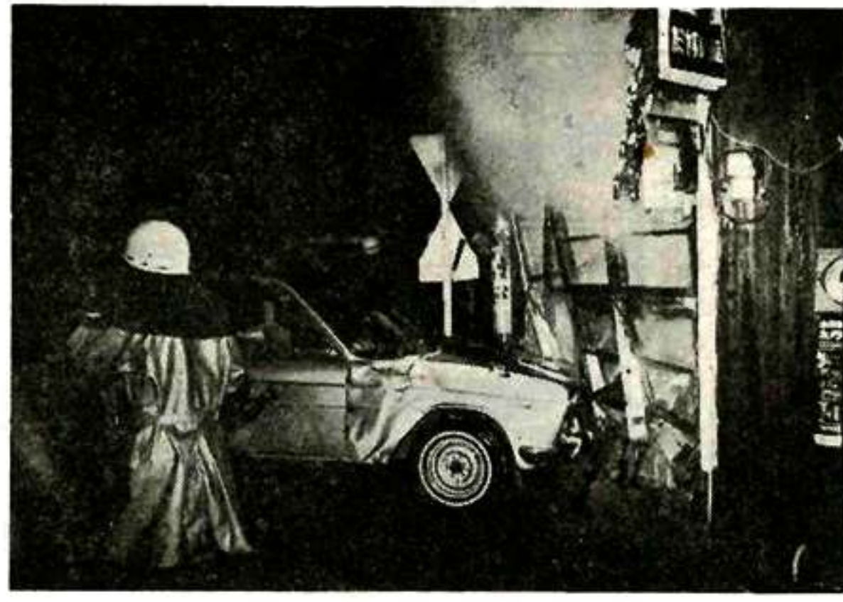
とび込んだ車が火事を起こす

昨年十二月から本年三月までの期間で実施した「第一回交通安全写真コンテスト」募集要綱による写真募集については、第一部一五点、第二部九点と、きわめて少数で、特にカラー作品はありませんでした。四月八日審査会を開き、つきのおり決定しました。なお、第二回コンテストは、五月一日から八月三十一日までの期間で行ないますが、前回のようには、応募対象を限定せず、広く一般から自由に応募していただくことになりましたので、多数の方がたの応募をお願いいたします。