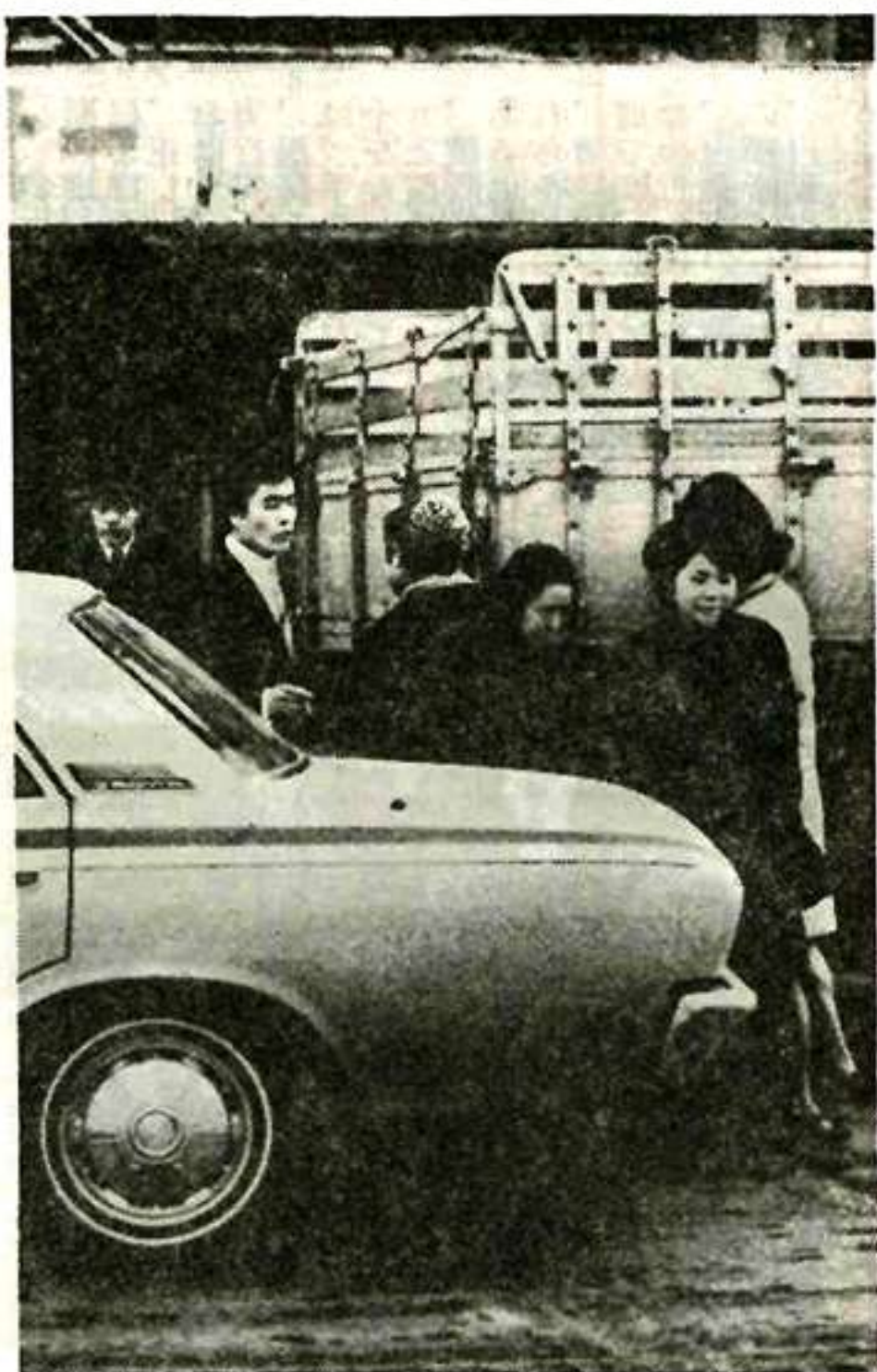
車をよけよう車のかげにまた車

◆追越し 追越し進路に、前方から進行してくる走行車両がないことを確かめ、安全に入らぬに、前車の前方の状況をも十分に確かめ、安全に入らぬ余地がある確信がなければ追越しはしない。追越しは、後方から車が接近してきたときは、しばしばバック