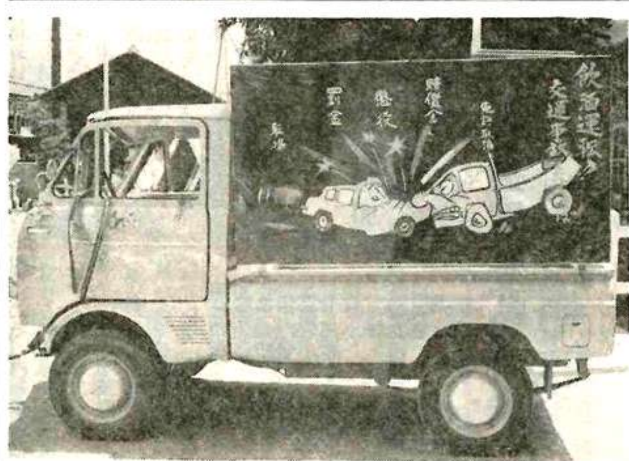
山梨市駅前に展示された事故車

山梨県交通対策推進協議会および山梨県警察と協力して、当協会でも、交通安全を促進するに努めています。 このカードは、交通安全協力員、交通推進せん協力員、山梨市駅前、交通安全写真展とともに期間中展示したもので、連日多数の人たちが見物に集まりました。