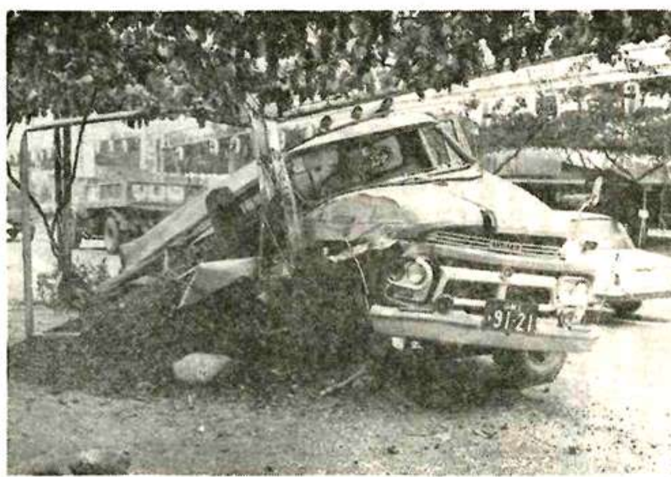
こわい飲酒運転(金貨)