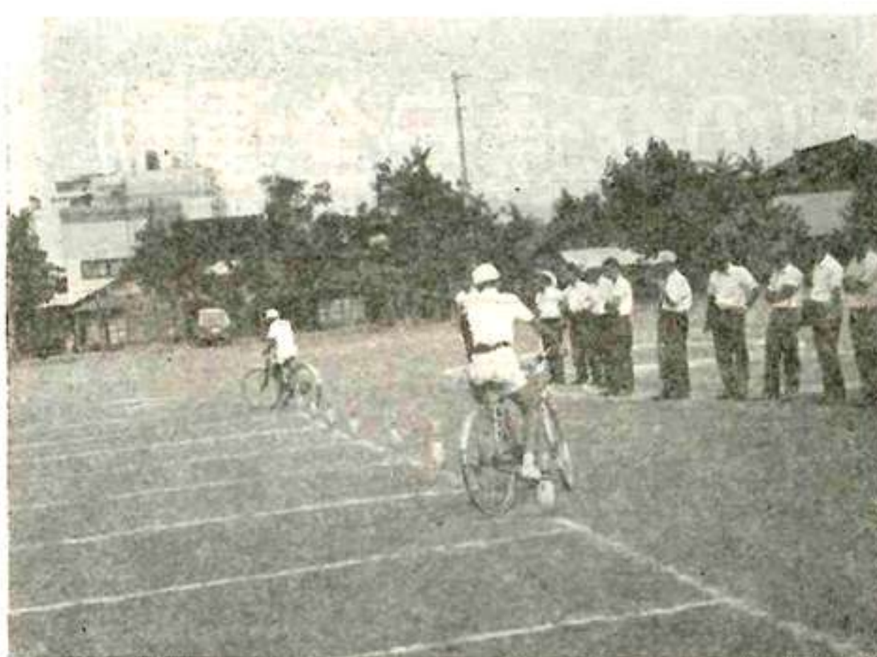
自転車の安全な乗り方講習会—甲府・相生小で