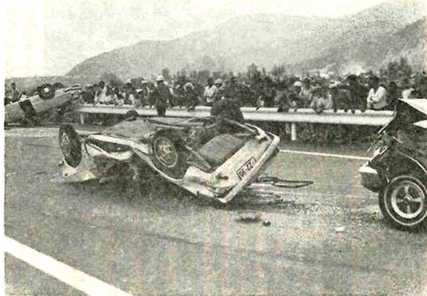
中央道の三重衝突(第2部最優秀賞)