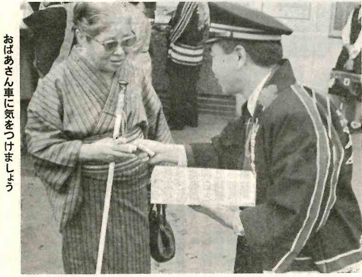
おはあさん車に気をつけましょう

幼児の交通安全教育のために、「幼児交通安全クラブ」の育成と、すでにつくられていたところではクラブ活動の定着化を図る。自転車利用の安全な乗り方の教育を実施する。歩行者、運転者に対する、交通安全意識を高め、安全運転を励むよう運転者教育を行なう。 ④交通安全の推進 新生活運動の展開によって起きている飲酒運転、事故防止のために、新生活運動を展開する。 運動のすゝめ方 ①スクールゾーンの歩行者用道路の拡大、クルマのスピードダウンの規制、安全施設を整備。 ②登下校時の保護者活動 ③交通安全指導の徹底