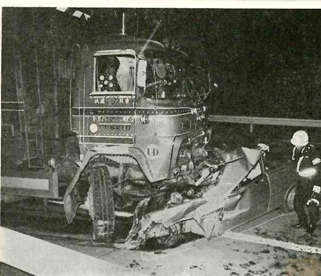
こんな事故はもうごめん

注意と保護をしていただきたいけれども、交通事故をこめて贈る腕章を贈る。腕章は、三月までに各警察署、交通安全協会を通じて小学校に新入生の児童数だけお届けします。