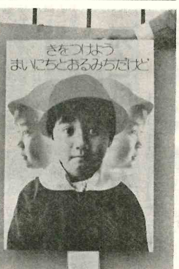
交通安全の大切さを伝えるキャラクター

安全実施効果の評価 実施事項である交通安全施策の実施効果の評価するため、減点方式により次の採点をを行う。 (1) 警察が、発生した事故をそのつど減点方式による採点をし、その点数と事件数を町村に電話連絡する。 (2) 速報を受けた町村は、直ちに交通安全防止減点表に記入する。 (3) 各町村はその内容を検討し、次の交通安全施策の