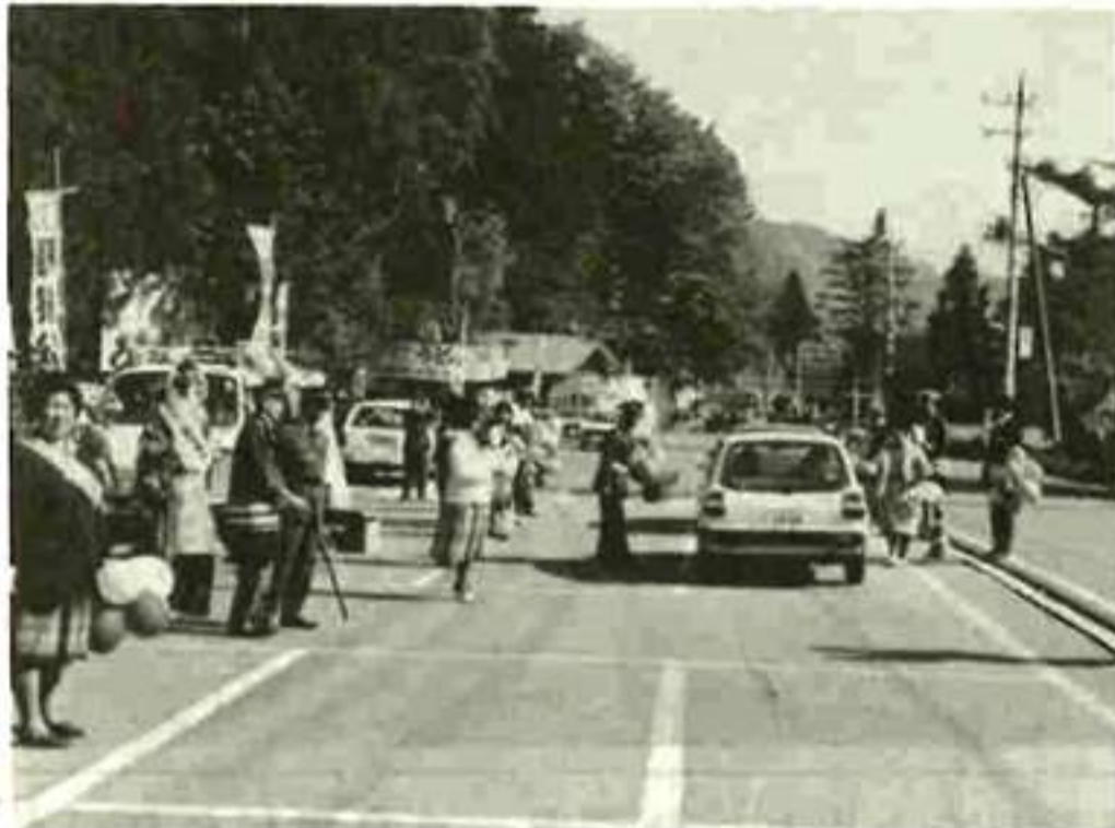
街頭で交通安全を訴える (富士吉田)