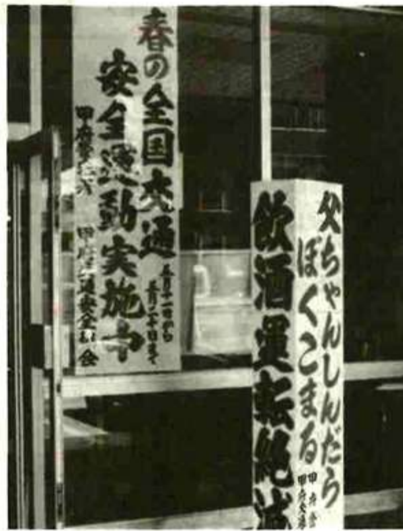
飲酒運転の絶滅を願って (甲府)

この年の春の交通安全運動は、五月十一日から二十日まで全国一斉に行われました。死者六人、傷者百三十二人、大規模な活動が続けることにより安全な社会づくりが実現するものと期待されています。