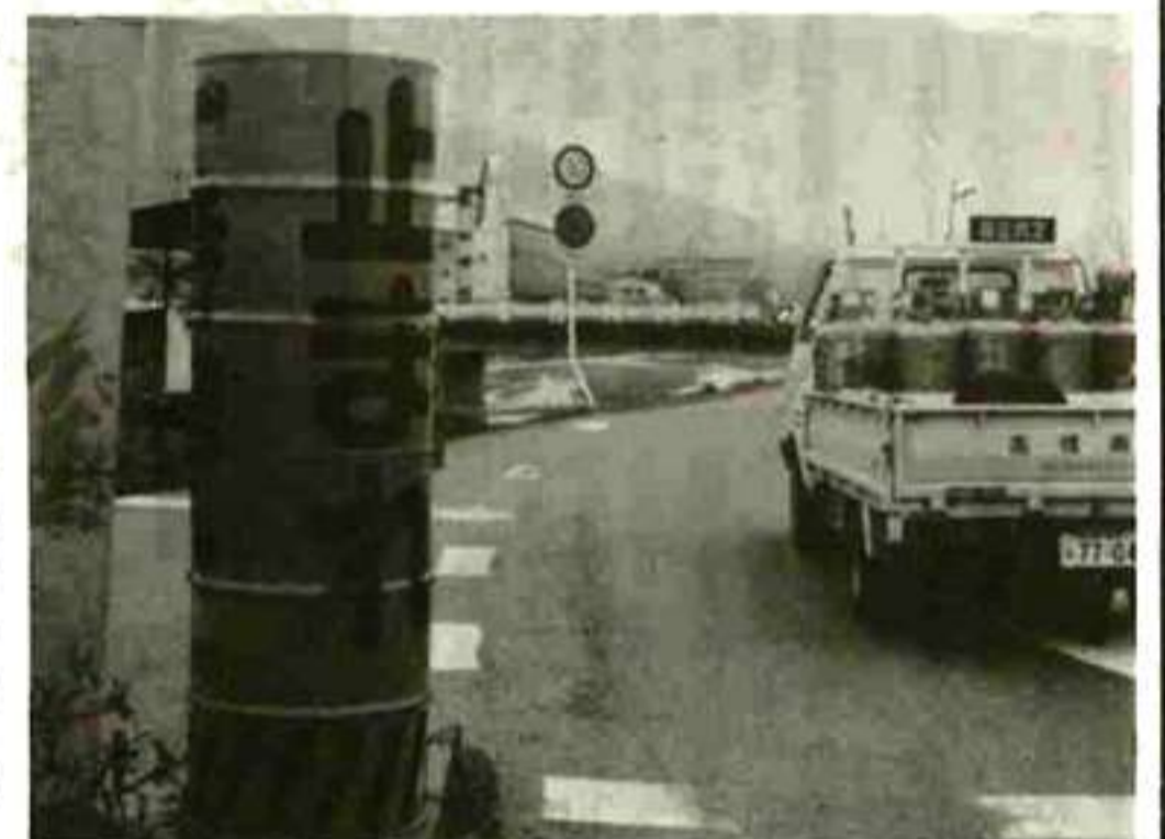
ドラム缶を利用し危険箇所へ掲出 (飯沢)