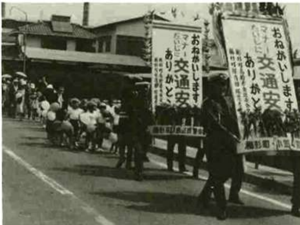
アヤメ(造花)を植えてありがとう運動をのぼす (小笠原)