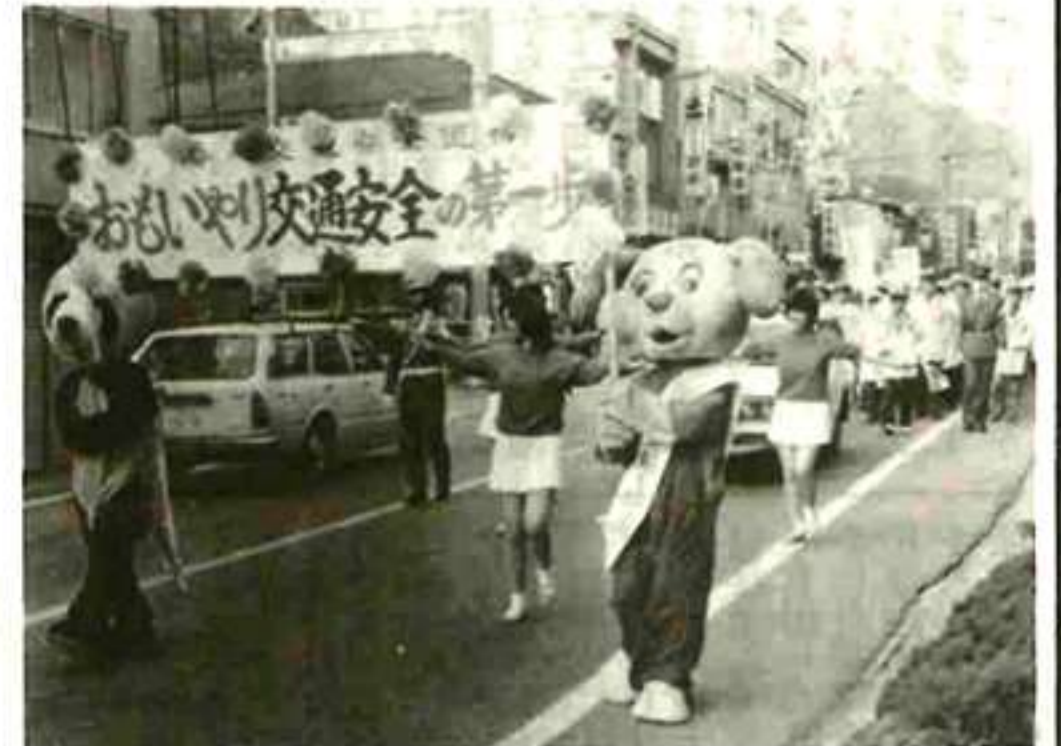
パレードで交通安全を訴える (大月)