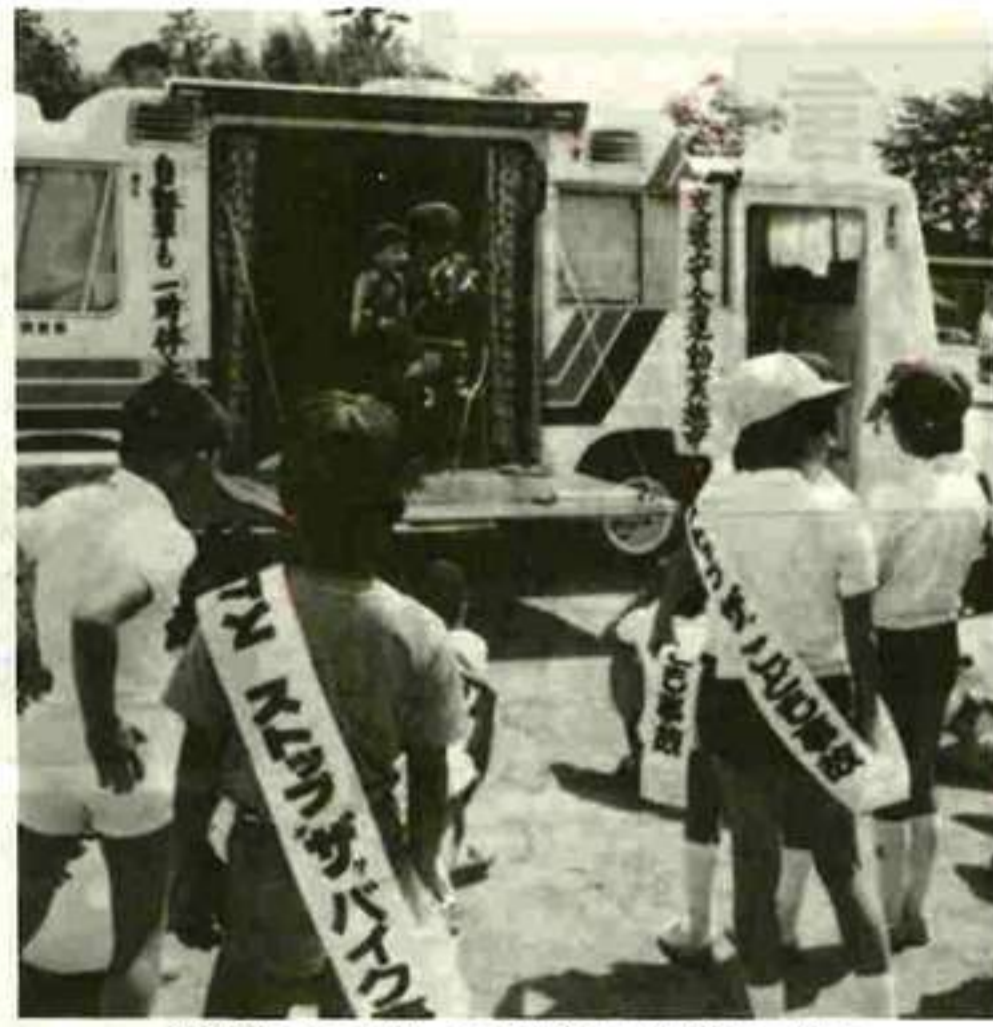
腹話術でこどもの事故防止を呼びかける (石和)