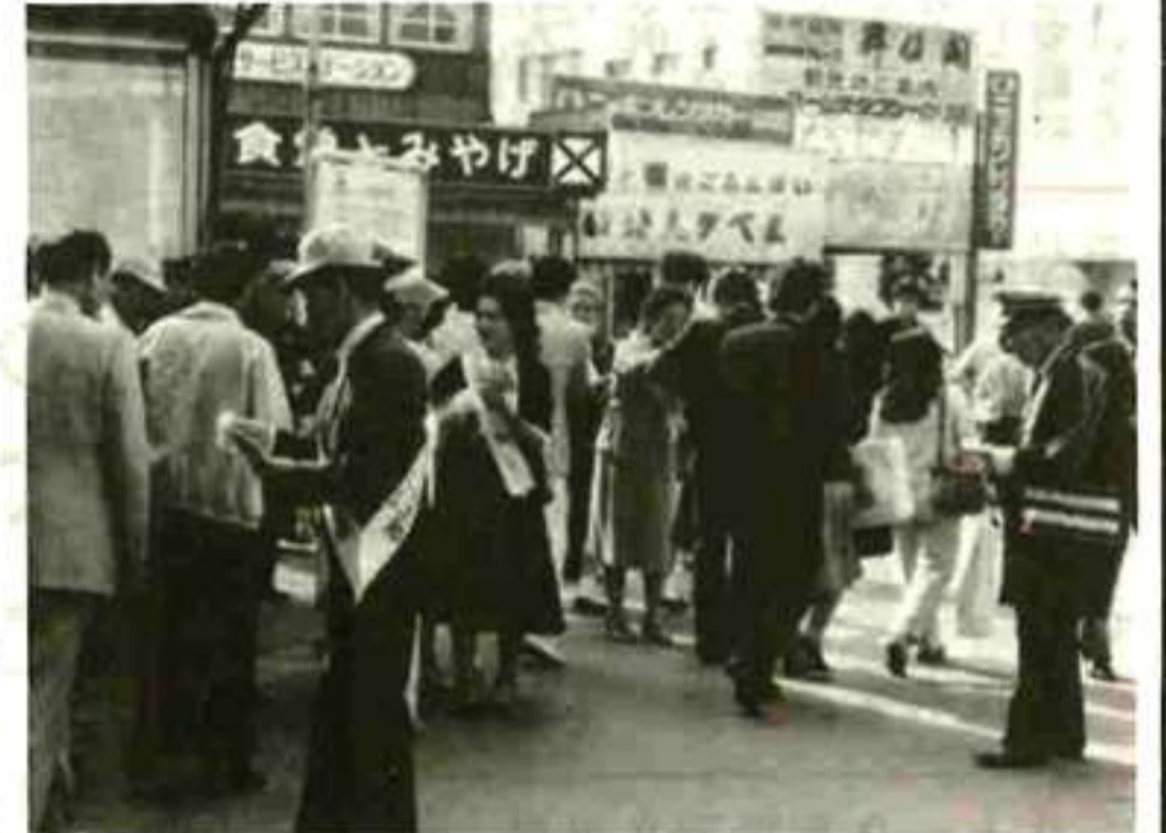
運動初日甲府駅頭で黄色い羽根を配布する (県交安協)