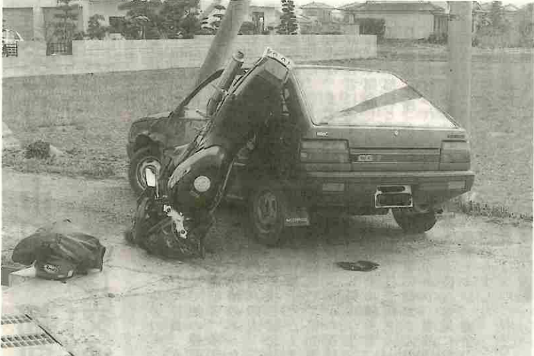
あぶない二輪車の暴走!

◇ 第 82 号 ◇ 発行所 甲府市丸の内一丁目6-1 財団法人 山梨県交通安全協会 TEL 甲府 (0552) 37-7827