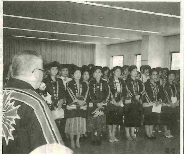
婦人部の結成大会(富士吉田)

富士吉田安協では、婦人の交通安全に果たす役割が大きいため、婦人部の設立を準備していましたが、その機が熟し、去る九月十九日、富士吉田警察署会議室で婦人部結成式を開いて発足しました。結成式は、地元市長や警察署長等の臨席をえて、渡