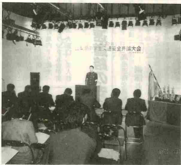
交通安全を訴える中学生

県交通安全協会、NHK甲府放送局、交通山梨新聞社主催の第30回県中学生交通安全弁論大会は、十月二十五日、甲府市飯田三丁目、NHK甲府放送局で開かれ、県内各地区予選大会で選ばれた十七名の選手が出席し、自分の体験や日ごろ交通安全について考えていることなどの意見を七分の持ち時間で発表しました。選ばれた皆さんは、甲乙つけ難い良い成績でしたが審査の結果「無関心であってはいけない」と題し、事故の事例をあげて事故は人ごとではなく身近な事として、いろいろの団体や個人が関心をもつて事故防止