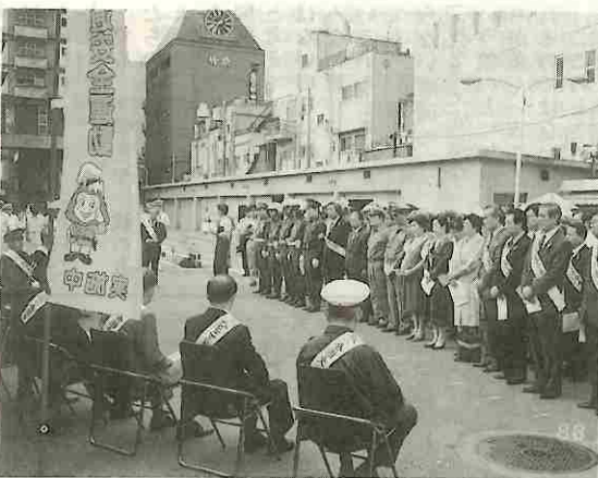
秋の交通安全運動の出発式開かれる（県交対協）

秋の全国交通安全運動は九月二十一日から三十日までの十日間実施され、本県では死亡事故抑止緊急対策と併せて行い、子供の交通安全広報、若年運転者交通