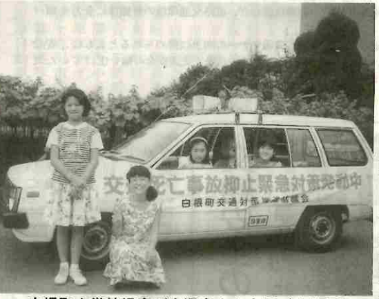
白根町小学校児童が交通安全を広報（小笠原）

小学生が交通安全を呼びかける（小笠原） 小笠原安協白根支部と、白根町交通安全推進協議会では、先に実施された交通安全活動の一環として、町内の「百田」、「源」、「飯野」、「東」の各小学校児童の代表延べ五〇人が、それぞれ交代で町の広報車に乗務し、かわいい声を張り上げて町民に交通安全啓蒙を呼びかけ、多くの町民から好評を得て効果をあげました。