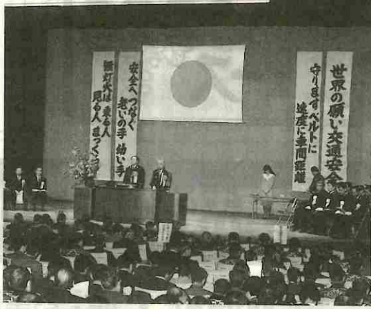
県民会館で交通安全関係表彰式開く