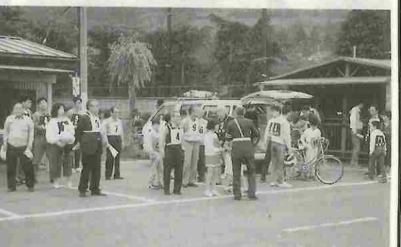
親子三代安全運転競技会、小中学生は自転車、20才未満は原付、60才以上は乗用車 — 鯉沢 —