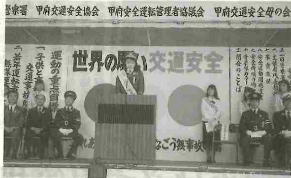
交通事故防止の決意新たに、安全運動出発式 — 甲府 —