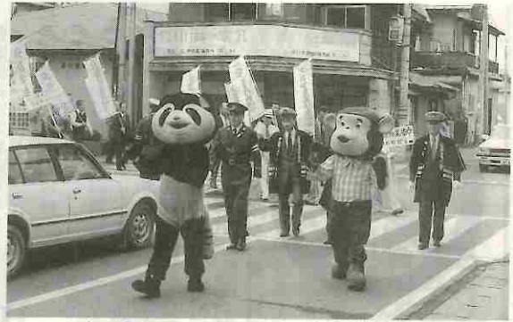
交通安全運動の周知と安全意識の高揚を図るための一大パレード — 小笠原 —