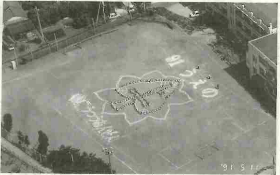
子供に交通事故防止と安全思想をうえつけるため「交通安全人文字」 — 市川 —

二百二十九件、死者二百七十二人、傷者一万九千五百九十九人で、前年同期と比べ、件数で千七百四十四人、死者で十四人、傷者で千五百七十三人いずれも減少しました。 厳しい交通情勢のなかで地道な活動を続けることにより安全な社会づくりが実現できるとの強い意思で、これからも交通安全活動にともどもに尽力してまいります。 運動期間中の各地区の皆さんの活躍ぶりをご紹介します。