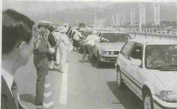
安全運転を、シートベルトの着用をと呼びかける街頭指導 — 石和 —