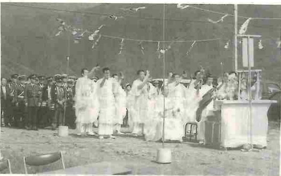
安全を願い安全を誓う祈願法要 — 南部 —