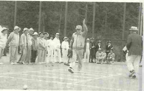
高齢者交通安全ゲートボール大会 — 都留 —