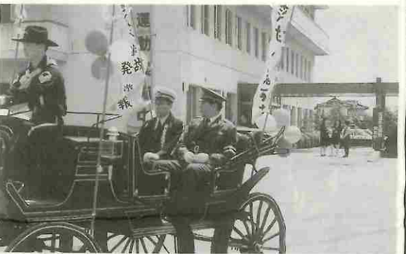
馬車も一役、交通安全パレード — 長坂 —