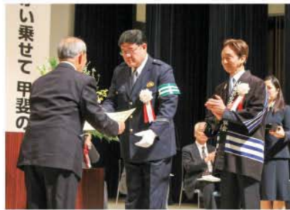
山梨県警察本部長・山梨県交通安全協会会長連名表彰