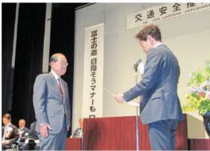
山梨県交通対策推進協議会会長表彰